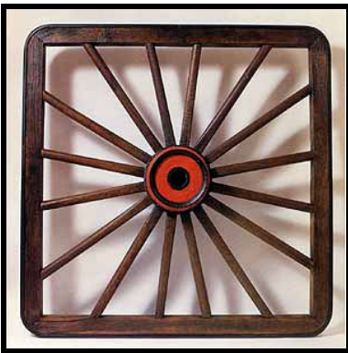
Poema objecte , Joan Brossa