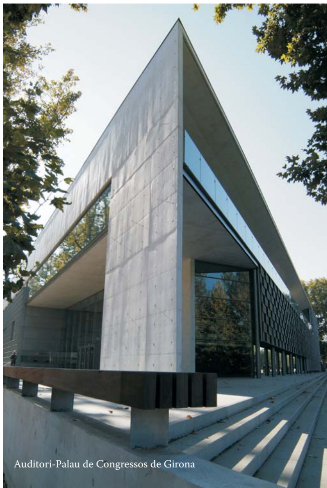
Auditori-Palau de Congressos de Girona

b. Ponencias y comunicaciones que giran preferentemente en torno a los siguientes temas: