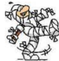
Ferit / ferida ↓