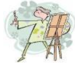
Pintor / pintora ↓