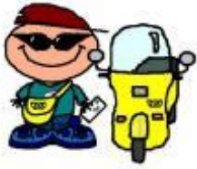
Carter / cartera →