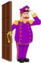
Porter / portera ↑