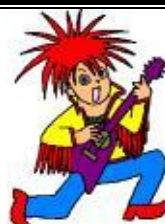
← músic / música