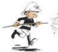
Bomber / bombera ↓