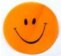
Jubilat / Jubilada