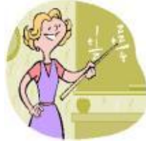
Mestre / mestra ↓