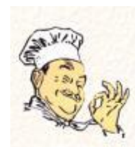
← Cuiner / cuinera