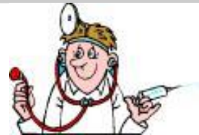
Metge / metgessa ↓