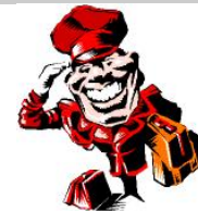
Xofer / xofera ↓