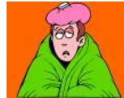
Malalt / malalta ↓